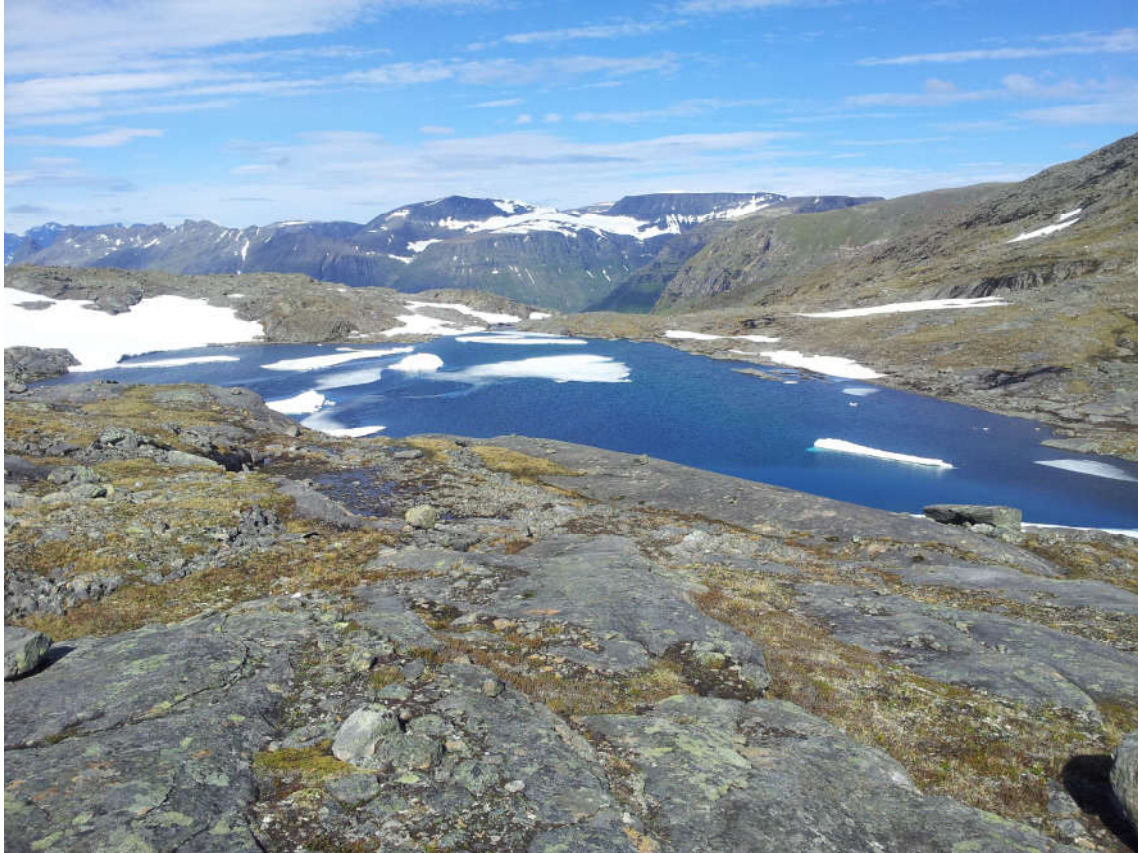
Bilde 4. Bogelvvannet 10 august 2015, fortsatt lav temperatur og is på vannet.

Utvasking av slam etter tunelldrif vil de første årene utgjøre et problem i form av partikulære masser i vannene nedenfor. Dette vil kunne gi jordsmak i fisk og føre til unødvendig lidelse for fisken.