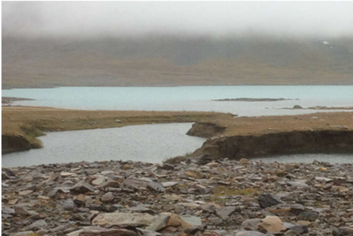
Bilde 3. Utvasking i Govdajavri som følge av ned tapping.

Nest etter Govdajavri gikk utbyggingen hardt utover Caccajavri, Sjørdalssmåvannene og Oksefjellvannene. I samtlige av disse vatnene fikk vi overtallig bestander av småvokst røye (tusenbrødre). I tillegg til et hardt garnfiske kan det også være andre faktorer som har bidratt til denne negative effekten. Halordalsvatnet (som TK omtaler som Boikiharjojavri) ble ledet over til Sjørdalssmåvannene og videre over til Caccajavri og Govdajavri. Halordalsvatnet (878 moh) er et brepåvirket vatn med svært lave temperaturer. Tilførsel av vann med lave temperaturer vil påvirke primærproduksjon i vann som Caccajavri som allerede har en marginal primærproduksjon. De nye planene vil forsterke effekten med nedkjølt vann, i tillegg til å overføre både fisk og mikroorganismer til nedenforliggende vann.