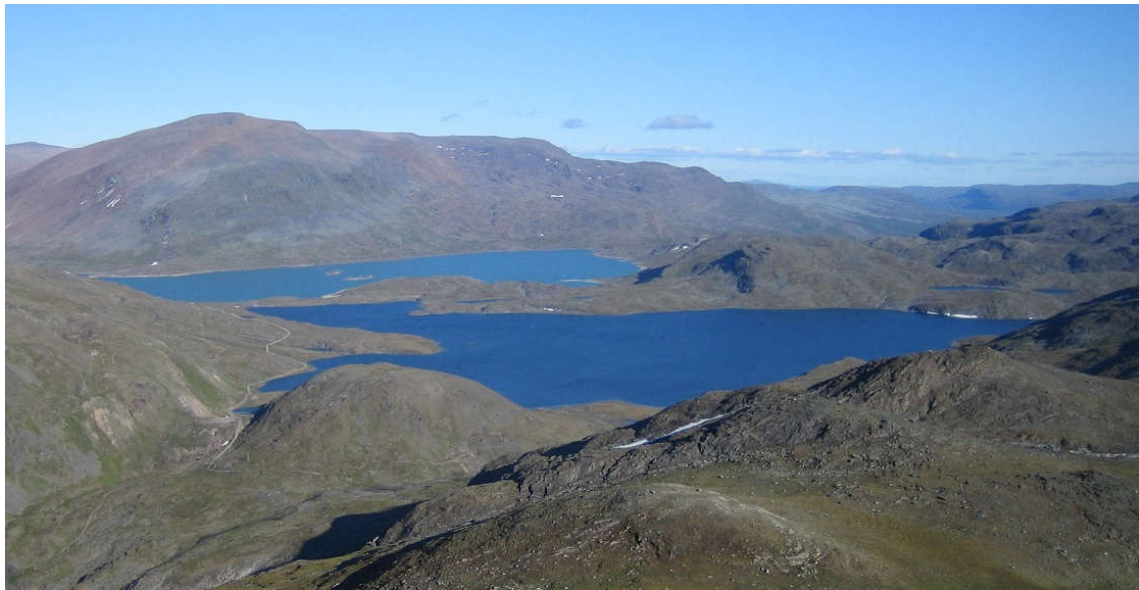
Bilde 1. Caccjavri i front og Goldajavri i bakgrunn. Vei til bunkeranlegg ses på venstre side av vannet.

Av: Kitdal Jeger og Sportsfiske Forening (KJSF)